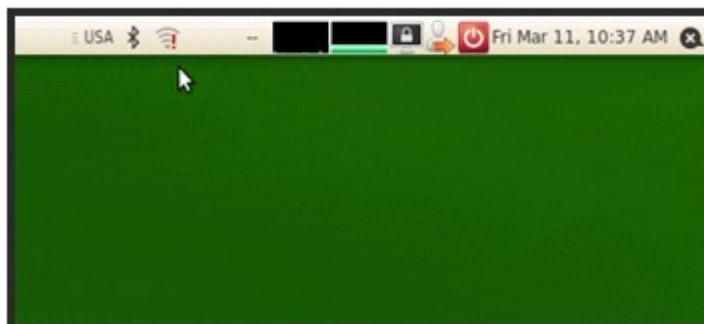
Slika 1. Network Manager aplet uoči povezivanja na eduroam

Korisnik koji dođe prvi put u okruženje u kojem je eduroam SSID zateći će status Network Manager apleta poput ovog na Slici 1 (iznad strelice), koji ukazuje na to da wireless mreža trenutno nije aktivna.