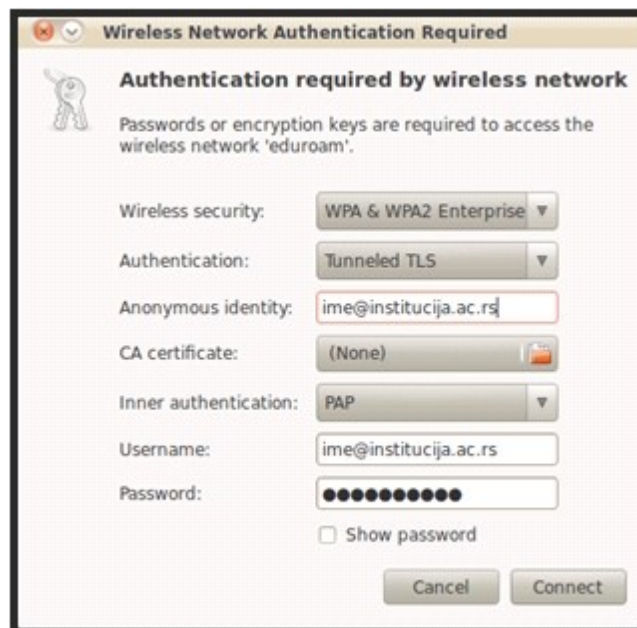
Slika 4. Način ispravnog podešavanja parametara

Ukoliko nemate snimljen sertifikat, kada se klikne na Connect , izaći će prozor prikazan na Slici 5.