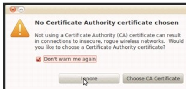
Slika 5. Upozorenje o nedostatku sertifikata sertifikacionog tela

Ukoliko nemate snimljen sertifikat, kada se klikne na Connect , izaći će prozor prikazan na Slici 5.