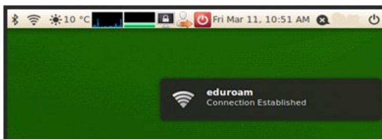
Slika 6. Eduroam je povezan!

Nakon toga će se računar povezati na eduroam mrežu, što će se videti pop-up informacijom poput ove na slici 6.