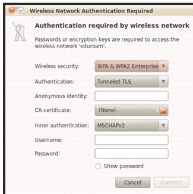
Slika 3. Inicijalni prozor za podešavanje eduroam wireless mreže

Treba kliknuti na eduroam. Nakon toga će se pojaviti prozor prikazan na slici 3.